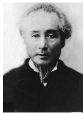
Figure 2 勝海舟