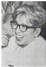
Figure 1 司馬遼太郎

「聖書は日本人にも決して遠くない書物なんだ」という事を分かって頂ければ幸いです。ご清聴ありがとうございました。