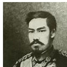
Figure 7 明治天皇