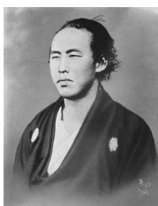
Figure 5 坂本龍馬